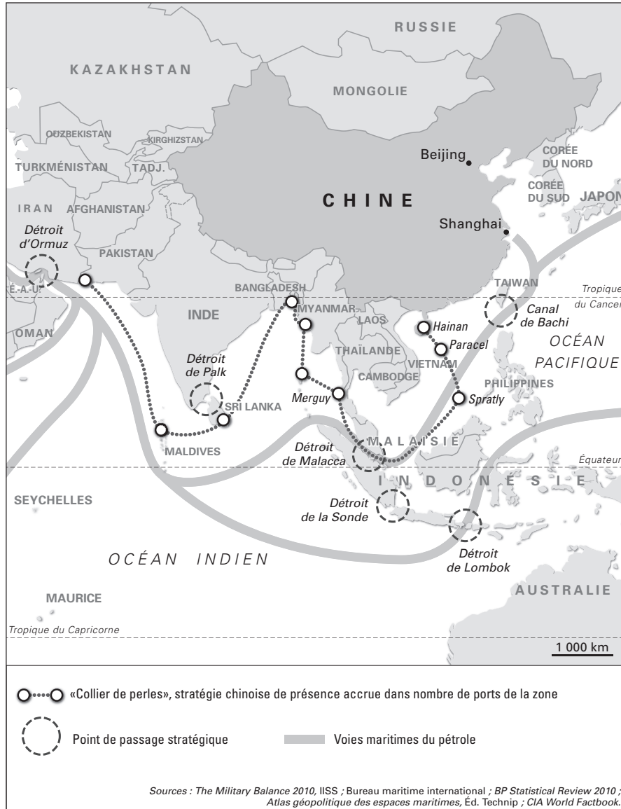
CARTE 2. – « LE COLLIER DE PERLES CHINOIS »